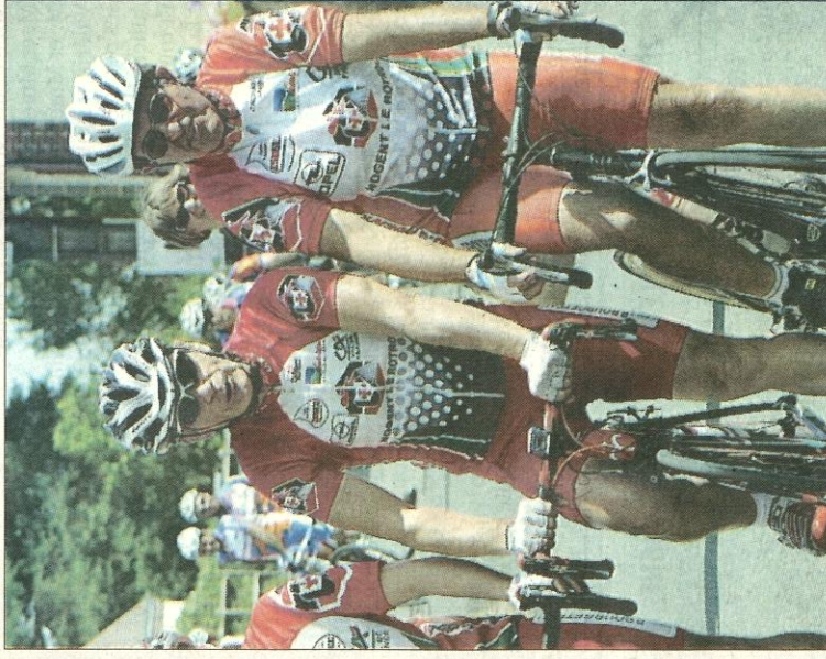
■ Aucune victoire pour les coureurs de l'US Nogentaise.